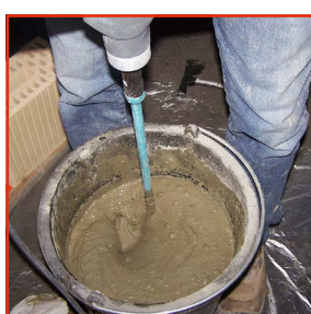
1. Mischen Dünnbettmörtel