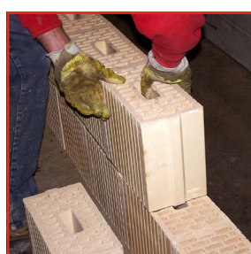
3. Versetzen EcoModul