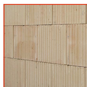
4. Sauberes und massgenaues Mauerwerk